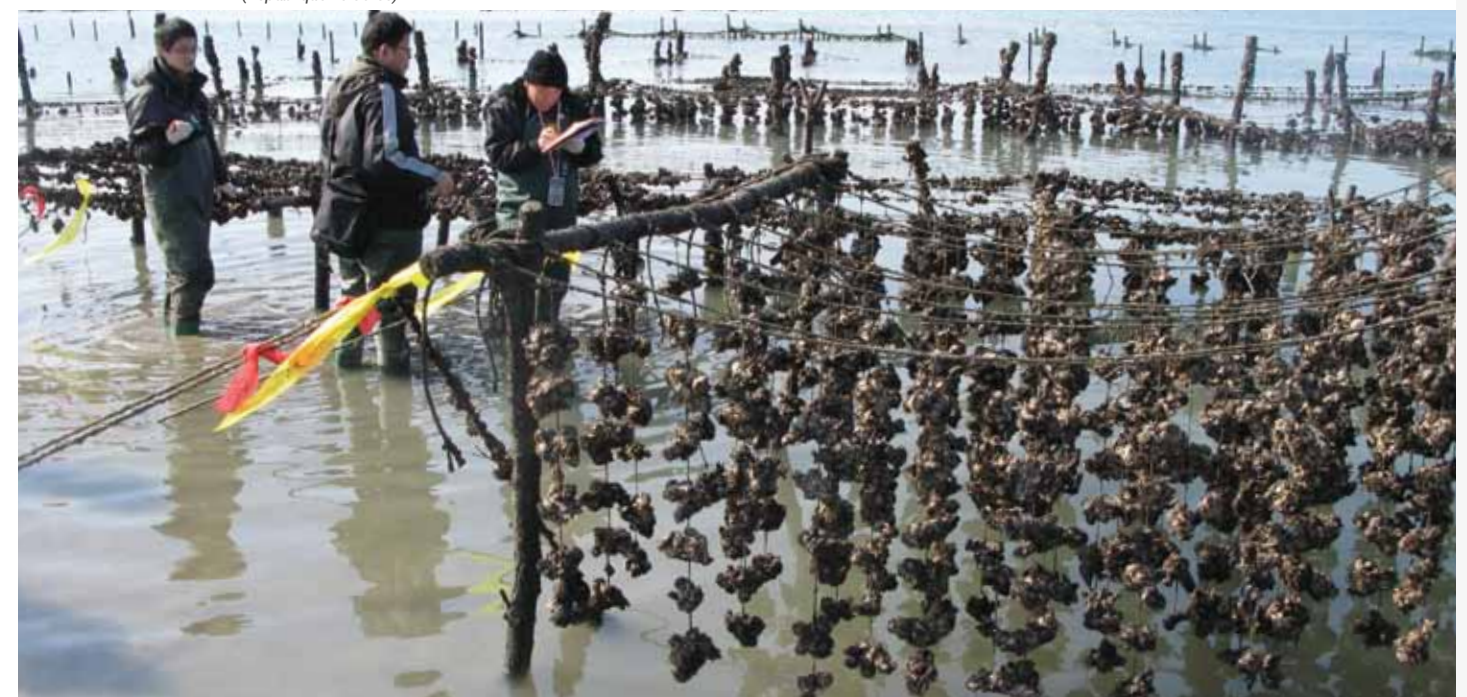
Des experts locaux engagés par le Fonds de 1992 évaluent les dommages par pollution causés à des fermes ostréicoles à la suite du sinistre du Hebei Spirit (République de Corée).